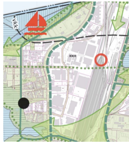
Kuva 3: Ote Kantakaupungin yleiskaava 2040 ja vaiheyleiskaava valtuustokausi 2017–2021, viherympäristö ja vapaa-ajan palvelut