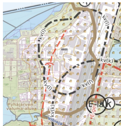
Kuva 4: Ote Kantakaupungin yleiskaava 2040 ja vaiheyleiskaava valtuustokausi 2017–2021, Kestävä vesitalous, ympäristöterveys ja yhdyskuntatekninen huolto