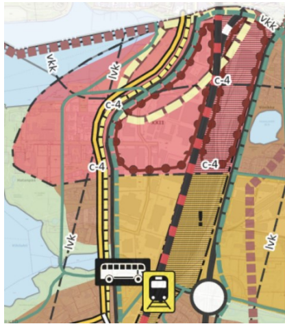
Kuva 2: Ote Kantakaupungin yleiskaava 2040 ja vaiheyleiskaava valtuustokausi 2017–2021, Yhdyskuntarakenne

konsultointivyohykkeellä, Pyhäjärven valuma-alueella sekä melu- ja ilmanlaatuselvitystarpeen harkinta-alueella.